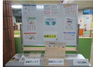
↑ 内服薬に関する展示