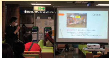
「安全なMRI検査に必要なこと」

毎年11月25日(いい医療に向かってGO)を含む一週間は「医療安全推進週間」と定められており、当院でも医療安全に関心をもっていただくための様々な行事を行いましたので紹介いたします。