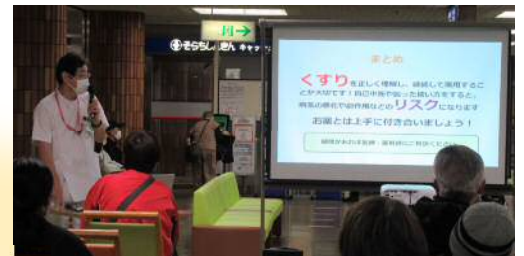
「薬の正しい使い方」