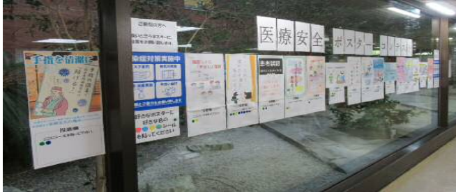
↑ 医療安全に関するポスター掲示